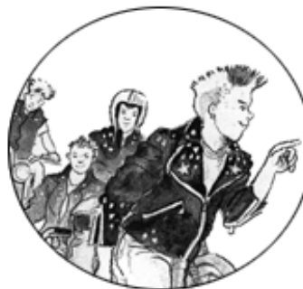
die Jugendbande der Schlangen