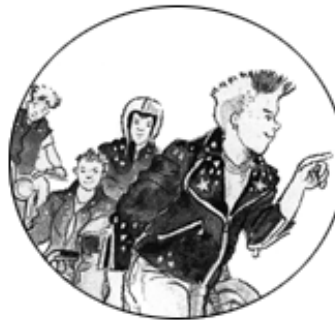
die Jugendbande der Schlangen